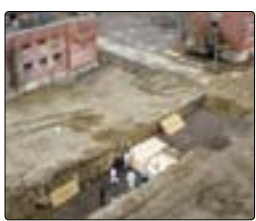
هالیوود در دوران پساکرونا احتمالاً تلاش می‌کند گورهای دسته‌جمعی نیویورک را بنیند یا با «چینی» خواندن کرونا واقعیت‌های مربوط به این ویروس را سانسور کند

بسیار دوست دارد. سرمایه‌داری حتی وقتی شرایط را به نفع خود نمی‌بیند و «بحران وال‌استریت» باعث آبروریزی در آمریکا می‌شود، تجویزی که دارد این است: همین‌ی که هست! «In time» را در بنبوحه همین بحران وال‌استریت می‌سازند که فیلم مهمی است. پاسخ‌ها در نظام بازار از پیش مشخص است، البته نظام سرمایه‌داری مرزهای اخلاقی مشخصی دارد اما خط قرمزی جز حفظ نظام سرمایه‌داری ندارد، چرا که «ای «پول» در میان است». یعنی خریدن زمان برای زندگی بیشتر و کمک به حفظ نظام سرمایه‌داری! سال گذشته وقتی سینمای کره توانست در صدر سینمای دنیا بنشیند و «انگل» از شرق آسیا و از کره که