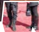
نامه جمعی از سینمایی‌ها:

دزدی نکردن؛ فقط به جابه‌جایی آهسته صورت گرفته