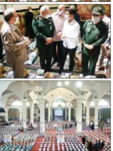
مسئول سازمان بسیج سازندگی کشور

همه مراکز شماره‌گذاری خودرو از امروز ۶ اردیبهشت‌ماه آماده ارائه خدمت به هموطنان سراسر کشور خواهند بود. سردار کمال هادیان‌فر، رئیس پلیس ناجا اظهار داشت: از روز شنبه ۶ اردیبهشت‌ماه مراکز شماره‌گذاری آماده ارائه خدمت به هموطنان سراسر کشور خواهند بود. وی ادامه داد: برای مدیریت و پیشگیری از تجمع مقرر شد ارائه خدمت در مراکز شماره‌گذاری براساس اطلاعات زوج و فرد باشد؛ به این شکل که در روزهای زوج فقط به خودروهای ورودی با پلاک زوج و در روزهای فرد برای خودروهای ورودی با پلاک فرد خدمات ارائه خواهد شد.