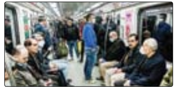
«وطن امروز» از حال و هوای این روزهای بازار سرمایه گزارش می‌دهد

تاکنون ۴۴۲ هزار و ۵۹۰ تست تشخیصی انجام شده که از این میزان ۲۰/۹ درصد تست‌ها مثبت شده است. ۶/۳ درصد کسانی که تست کرونای آنها مثبت بوده، فوت کرده‌اند