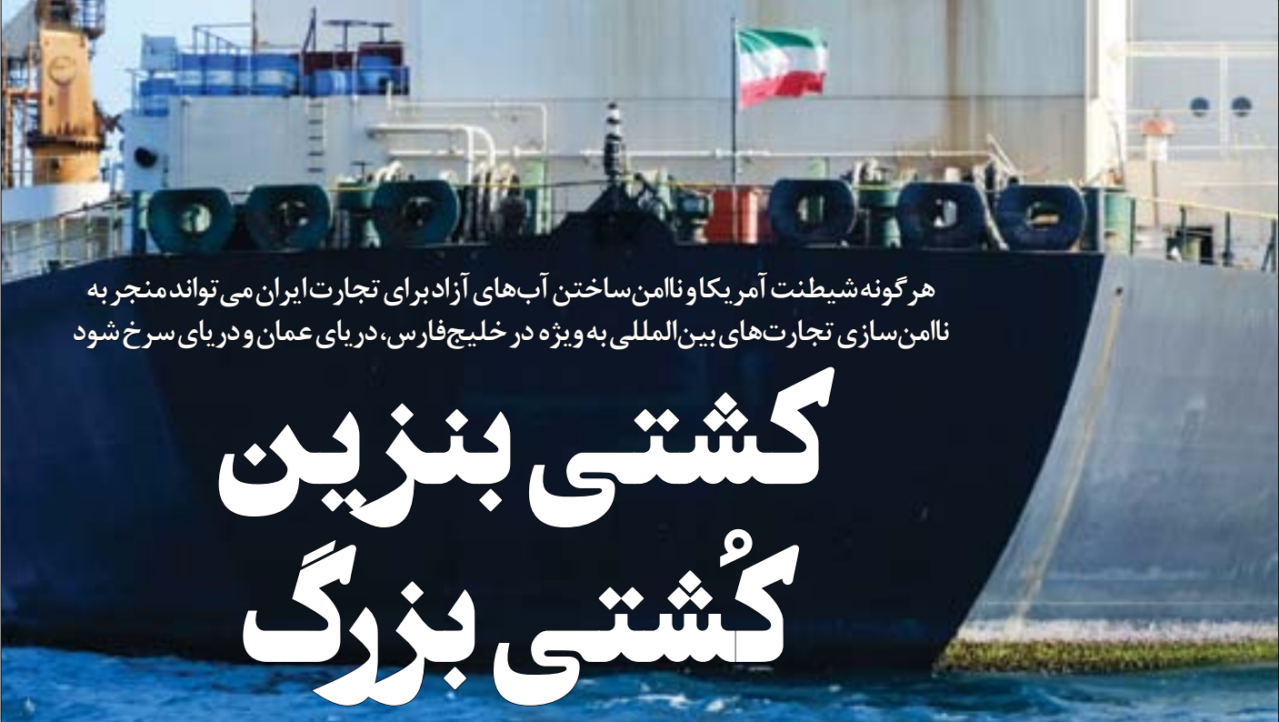
در گفت‌وگو با خبرنگارای انگلیسی رویترز مدعی شد واشنگتن

به گزارش فارس، سردار قاسم رضایی در جلسه شورای عمومی ستاد مرزبانی ناجا با اشاره به جریان‌سازی سازمان‌یافته رسانه‌های معاند علیه مرزبانان در منطقه مرزی تایباد گفت: روز گذشته نشست مطلوبی بین مرزبانان ۲ کشور ایران و افغانستان در تایباد برگزار شد. جانشین فرمانده نیروی انتظامی با تاکید بر اینکه هر گونه تردد غیرمجاز در مرز جرم است، ادامه داد: مرز جایگاه ملی و بین‌المللی دارد و مرزبانان همواره کوشا هستند و به دور از هر گونه تنش از سرحدات ایران اسلامی حراست و پاسداری می‌کنند.