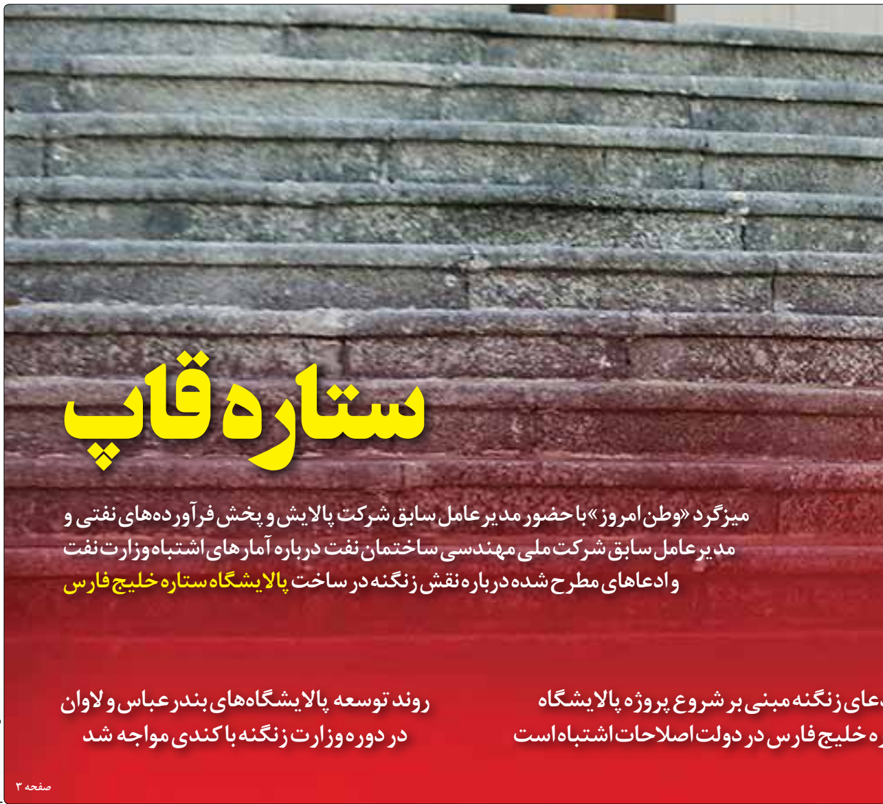
عکس مقامات دولتی