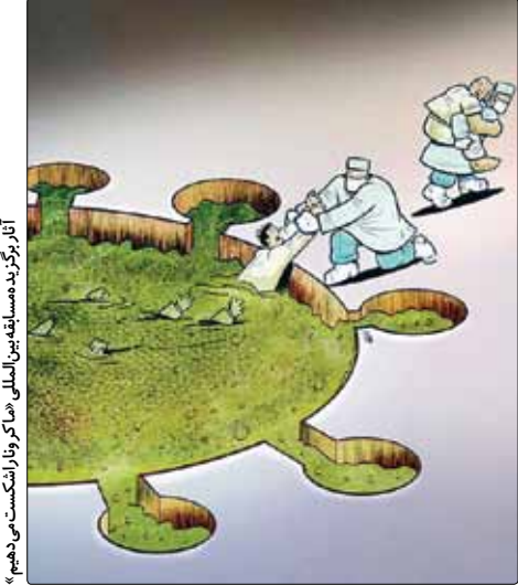
آثار برگزیده مسابقه بین‌المللی کارتون «ما کرونا را شکست می‌دهیم»