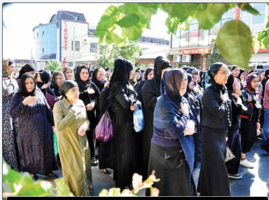
دسته عزاداری عاشورا در شهر دربند در جمهوری داغستان روسیه

همه‌گیری کرونا و قرنطینه سخت و سخت چند ماهه اخیر مانع از آن نشد که در گوشه و کنار اروپا، مجالس سوگواری حسینی با رعایت پروتکل‌های بهداشتی برپا نشود. تشکیل هیأت متعدد در بریتانیا، نوحه‌خوانی شب عاشورا به زبان دانمارکی در مسجد امام علی (ع) کپنهاگ، برگزاری مجالس عزای مرکز اسلامی اهل بیت (ع) در زوریخ سوییس و ورشو لهستان، برگزاری مراسم تاسوعا در فضای باز مرکز اسلامی برلین و برپایی ایستگاه عاشورا در شهر استاونگر نروژ در رسانه‌ها بازتاب داشته است.