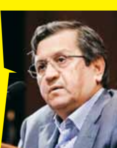
رئیس کل بانک مرکزی