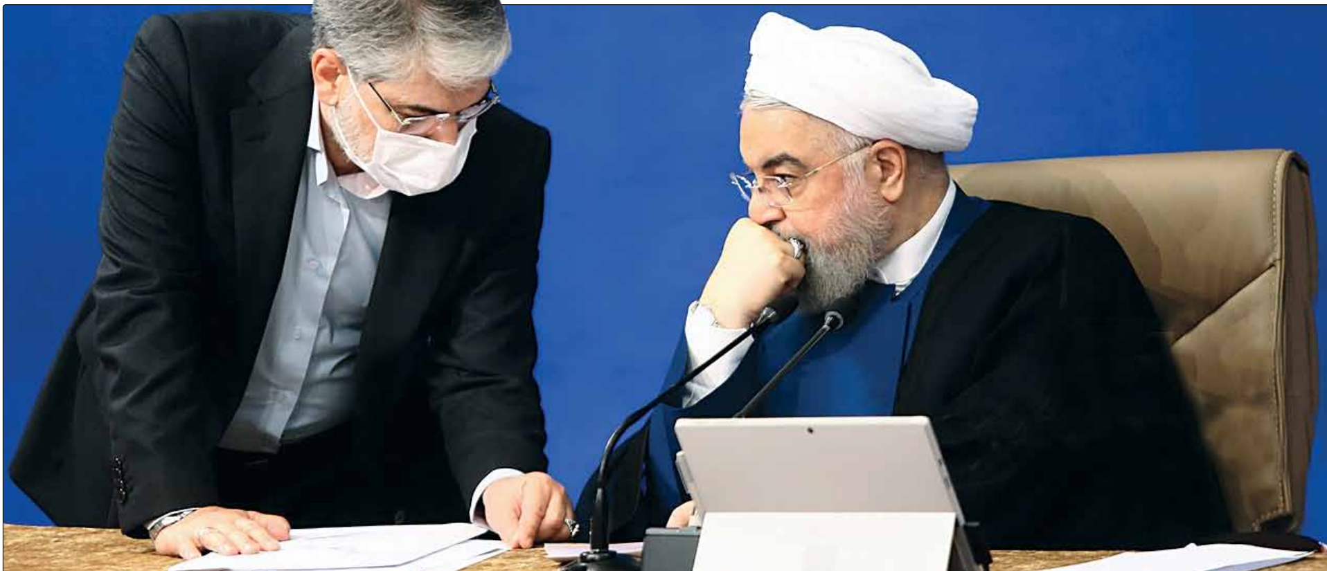
روایت روحانی از تحریم‌های فعلی و مقایسه آن با تحریم‌های دوره‌های قبل