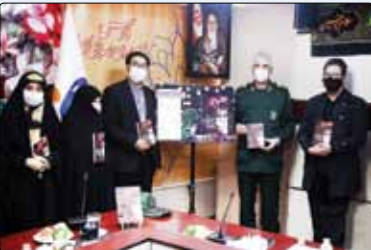
رونمایی از کتاب خاطرات شهید رجب محمدزاده

این کتاب شروع کردم. سال ۹۶ یکی از اساتیدم در مشهد با نام آقای عباس‌زاده سوزنه این کتاب را به من معرفی کردند و بلافاصله تماس گرفته و به منزل‌شان مراجعه کردم. پس از صحبت علاقه‌مند به کار شدم، از آن پس حدود ۲ سال (نه به شکل پیوسته) کار را انجام دادم. وی درباره زمان تألیف و اتفاقات آن روزها گفت: تمام این مدت با خاطرات این خانواده زندگی کردم و هر روز تصور می‌کردم اگر جای بابا رجب و اعضای خانواده ایشان بودم چه حسی داشتم. من سعی کردم تمام موارد مطرح