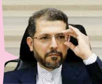
سعيد خطيب زاده سخنگوی وزارت امور خارجه