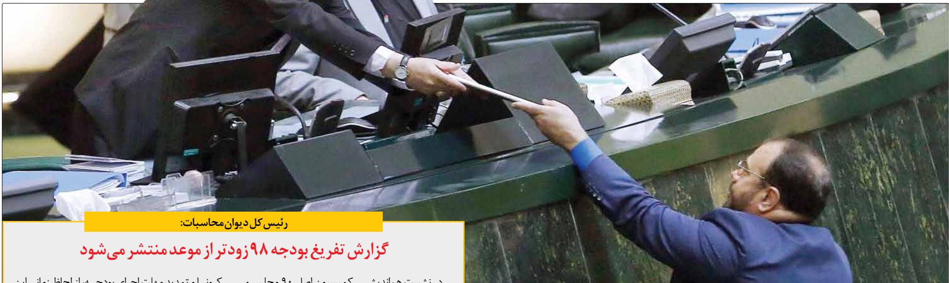
رئیس کل دیوان محاسبات:

شاخص کل بورس اوراق بهادار تهران در پایان معاملات دیروز با کاهش ۲ هزار و ۶۹۰ واحدی به رقم یک میلیون و ۴۷۰ هزار و ۹۷۵ واحد رسید. شاخص کل هموزن اما با افزایش ۳۲۸۳ واحدی به رقم ۴۲۳ هزار و ۱۶۸ واحد رسید. دیروز معامله گران بورس تهران بیش از ۱۴/۵۸ میلیارد برگه سهام به ارزش ۱۵ هزار و ۸۲۶ میلیارد تومان دادوستد کردند.