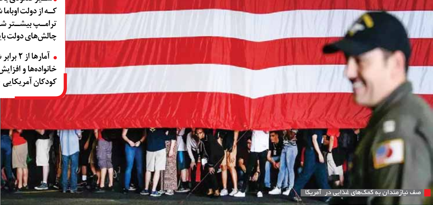
صف نیازمندان به کمک‌های غذایی در آمریکا

گروه بین‌الملل: «کاملا هریس» معاون رئیس‌جمهور منتخب آمریکا در تازه‌ترین اظهار نظر خود با اشاره به وضعیت یفرنج اقتصادی و معیشتی مردم آمریکا به وجود بحران گرسنگی در این کشور اذعان کرد. این اظهارنظر در کنار انتشار آمارهای وحشتناک از تعداد خانواده‌هایی که با ناامنی غذایی دست و پنجه نرم می‌کنند و کودکانی که در آمریکا با بحران تغذیه مواجه هستند، در نگاه اول حاکی از این است که دولت باینن زمین سوخته‌ای را از ترامپ تحویل گرفته است اما نگاهی به آمارهای مربوط به بحران غذا و ناامنی غذایی در دولت اوپاما نشان می‌دهد این روند در تاریخ معاصر دولت‌های آمریکا وجود داشته و ترامپ میراث بی‌نقصی را از اوپاما تحویل نگرفته بود.