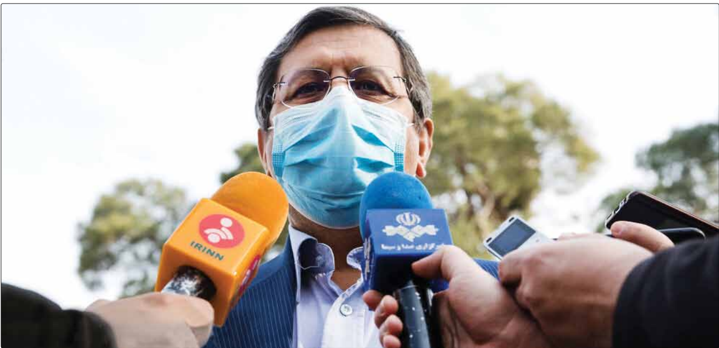
ادعای عجیب رئیس کل بانک مرکزی:

شاخص کل بازار سرمایه در پایان معاملات روز گذشته با ۳۳ هزار و ۲۳۰ واحد افزایش به رقم یک میلیون و ۱۸۲ هزار و ۹۴۸ واحد رسید. همچنین شاخص کل هموزن با ۲ هزار و ۷۰۵ واحد افزایش به رقم ۴۳۳ هزار و ۱۲۹ واحد افزایش یافت. در جریان معاملات روز گذشته بازار سرمایه حدود ۶ میلیارد سهم به ارزش تقریبی ۷ هزار میلیارد تومان دادوستد شد.