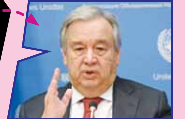
دبیر کل سازمان ملل