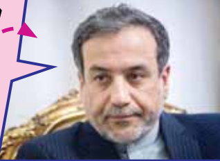
معاون سیاسی وزارت امور خارجه