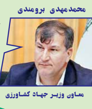
معاون وزیر جهاد کشاورزی