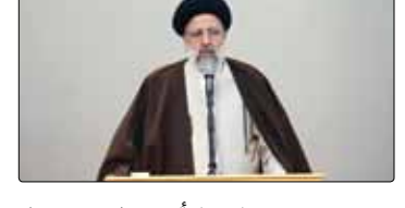
رئیس قوه قضائیه با تأکید بر لزوم پرهیز از جناح و جناح‌بازی در وزارت اطلاعات، تأکید کرد: در وزارت اطلاعات فقط یک جناح وجود دارد و آن هم جناح انقلاب و ولایت است.