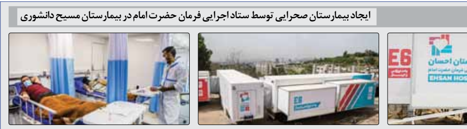
ایجاد بیمارستان صحرائی توسط ستاد اجرایی فرمان حضرت امام در بیمارستان مسیح دانشوری

نمکی گفت: در عین حال روند تولید واکسن داخلی‌مان یخویی پیش می‌رود. دیروز (دوشنبه) در اصفهان فاز سوم آزمایش بالینی واکسن پاستور را آغاز کردیم. فاز سوم واکسن برکت روز قبلیش آغاز شد و تولید بقیه واکسن‌ها هم با قدرت پیش می‌روند. در آینده بسیار نزدیک مجموعه واکسن‌های داخلی‌مان به واکسنیاسیون کشور خواهد پیوست.