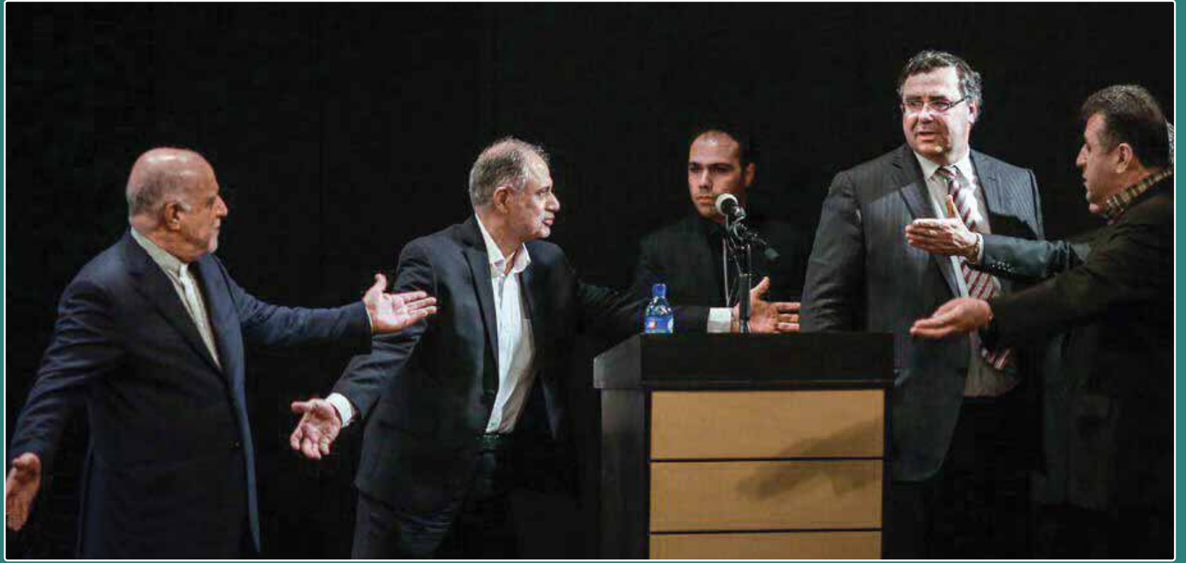
مروری بر عملکرد دولت‌های روحانی در جذب سرمایه‌گذاری خارجی