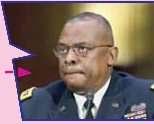
وزیر دفاع آمریکا