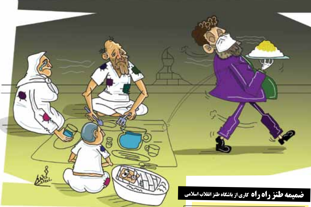
ضمیمه طنز راه راه کاری از بازگاه طنز انقلاب اسلامی

جمعی از رعایای بلاد سوی پادشاه آمده خشم آلود، وی را گفتند چه نشستهای که فلان کار گزارت یقه مردمان بدریده و خانه های شان بر سرشان خراب کرده، روی جنگجویان معبد شانولین سفید نموده و دست شیطان رجیم از پشت بسته، مردمانش را جرواگر کرده و همسایگانش از انفاس صلح آمیز وی مستفیض گشته اند. پادشاه لختی به سقف بالای سرش نگرست و ندانست ایشان را چه جوابی دهد که هم دست از سر کچلش بردارند و هم فلان کار گزار را خم به ایرو نیاید. ملک، ارکان دولت را گفت: جزای چنین کسی چه باشد؟ یکی گفت او را عزل نموده و مال و اموالش را توقیف کرده و خودش را به زندان عقوبت ببندازید تا به سزای عملش رسیده و حق به حق دار برسد. آن دیگر گفت که ما نیز از دست او شکاریم. پول ما را نیز بالا کشیده و برای خودش برج ساخته و جیبش را تا خرتلاق پر از اشرفی نموده... پادشاه نزدیک بود رأی بر عزل او صادر کند که ناگهان یادش آمد خودش نیز از او پول دستی گرفته و برای پادشاهی اش چندین نفر از رقبا را سقط گردانیده، زین سبب دستور داد شاکیان را از دم تیغ گذرانند تا درس عبرتی باشد برای سایرین که دیگر کسی سراغ عدالت از وی نگیرد. کار گزار را نیز فرمود از خزانه مملکت عطایی بخشیده و نظامیانش را با شمشیرهای فولادین ساخت رئیس مویالمو تجهیز کنند... آری این چنین است!