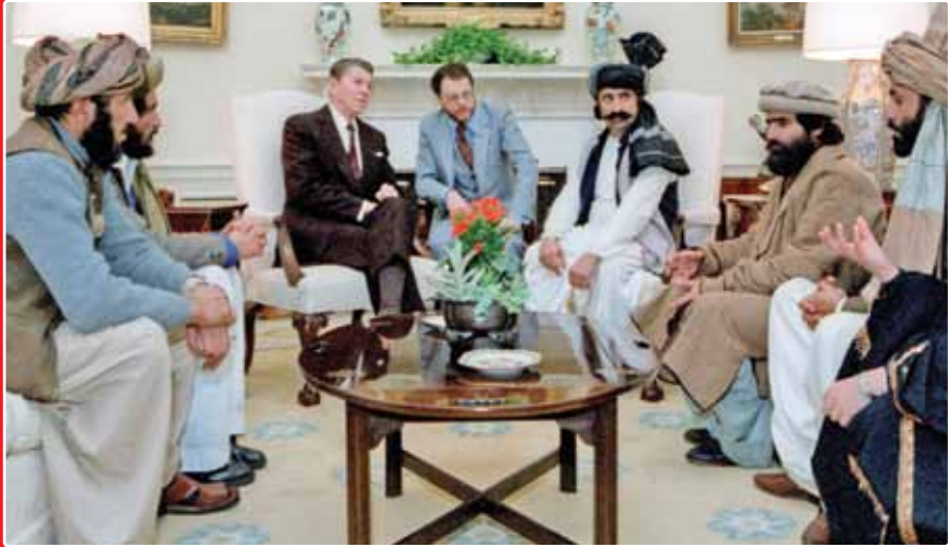
دیدار رونالد ریگان، رئیس‌جمهور وقت آمریکا با اسدالله طالبان

نخست‌وزیر پاکستان با اشاره به اینکه برای کاهش یا قطع ارتباط با چین از سوی آمریکا تحت فشار قرار دارد، گفت: غیرمنصفانه است که آمریکا و دیگر قدرت‌های غربی انتظار داشته باشند کشورهایمانند پاکستان با هر کسی طرف شوند. به گفته وی، هیچ چیز نمی‌تواند روابط پاکستان و چین را تغییر دهد. نخست‌وزیر پاکستان یادآور شد، روابط دوستانه پاکستان و چین بیش از ۷۰ سال قدمت دارد و این روابط دیرینه را هیچ چیز تغییر نمی‌دهد.