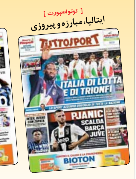
[آس] ۴ مدال و یک افسانه