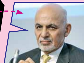
رئیس‌جمهور سابق افغانستان