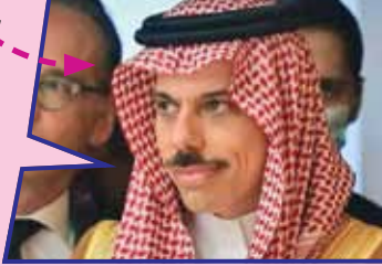
وزیر امور خارجه سعودی