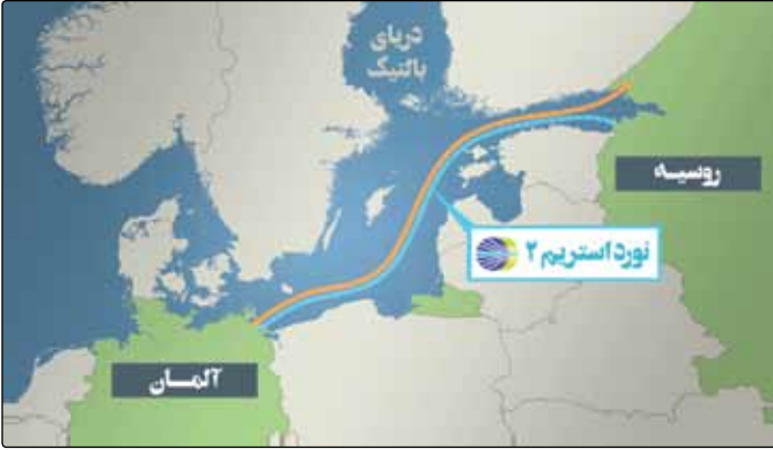
نوردر استریم ۲

با این توجه که لوله مورد نظر اوکراین را دور زده و این کشور را از سود ناشی از انتقال گاز محروم می‌کند، با این پروژه مخالفت می‌کرد اما سرانجام دولت واشنگتن با روی کار آمدن جو بایدن با چرخشی کامل در سیاست خود در این زمینه و با هماهنگی و کمک دولت برلین با انجام این پروژه موافقت کرد و به اختلافات پایان داد. تا پیش از احداث «نورد استریم ۲»، مسیر انتقال گاز طبیعی روسیه به اروپا از طریق زمینی از اوکراین می‌گذشت و این کشور سالانه یکونیم میلیارد دلار از این بابت عایدی داشت اما