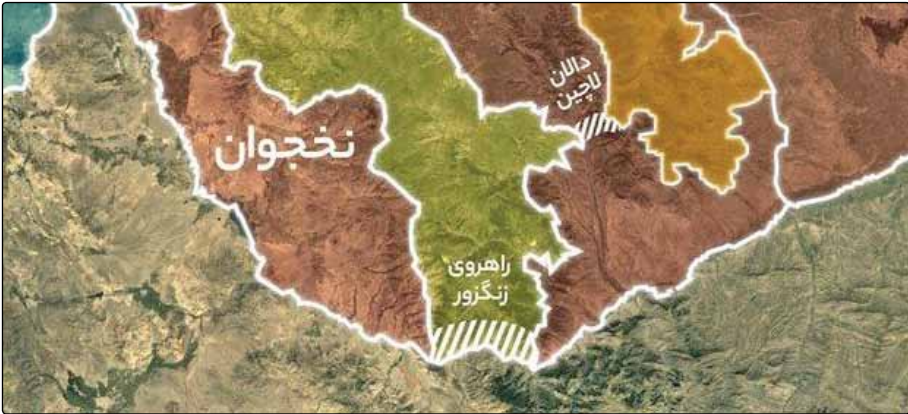
دالان زنگزور که نخجوان را از طریق خاک ارمنستان به جمهوری آذربایجان متصل می‌کند