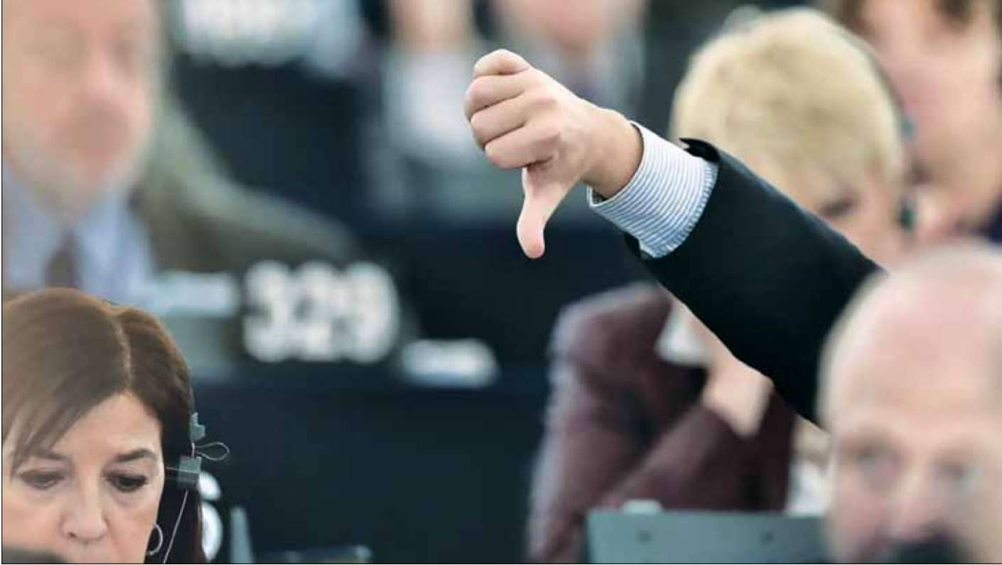
صحن عمومی پارلمان اروپا