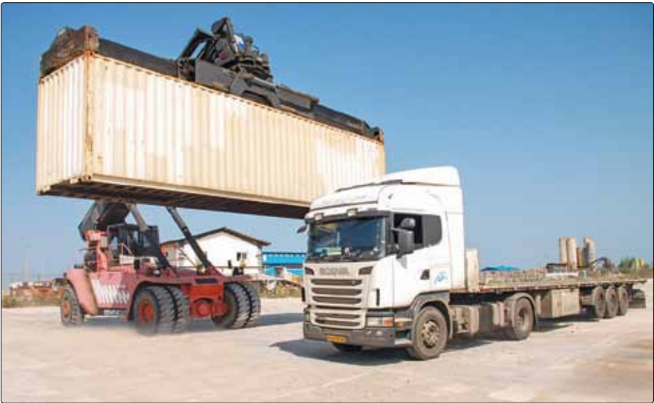
یک کامیون ایرانی در حال بارگیری یک کانتینر در بندر امام خمینی، تهران.

انبوه‌سازان دیروز در گفت‌وگو با ایرنا درباره نتیجه جلسه مشترک انبوه‌سازان با وزیر راه‌وشهرسازی افزود: جلسه خوبی که هفته گذشته با مدیران وزارت راه‌وشهرسازی بر گزار شد منجر به یکسری تفاهمات و حصول مشترک بین دولت و بخش