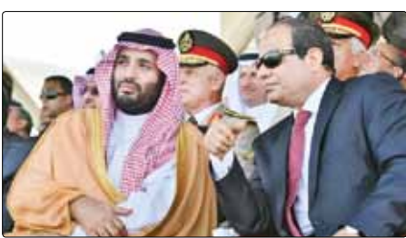
محمد بن سلمان و محمد بن زayed

او مانع توسعه روابط ریاض و قاهره می‌شود.سعودی‌ها با را از این هم فراتر گذاشته و به مقامات مصری گفته بودند «محمد ابوالغیط» دبیرکل اتحادیه عرب باید بر کنار شده و شاکله این سازمان باید تغییر کند. این درخواست تعجب مقامات قاهره را برمی‌انگیزد،