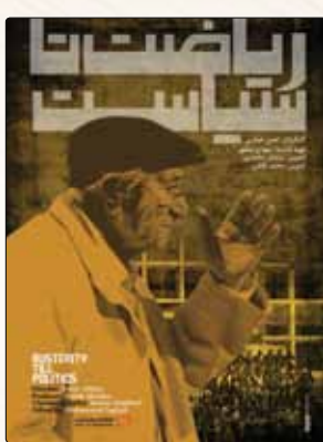
تاسیاست» در ۲ بخش مسابقه فیلم‌های نیمه‌بلند و جایزه شهید آوینی باعث می‌شود به انتخاب اول خیلی از مخاطبان جدی سینمای مستند برای تماشا تبدیل شود.

در میان آثار جشنواره امسال شاید «ریاضت تا سیاست» کنجکاو برانگیزترین مستند باشد؛ پرتوهای از مرحوم «ابراهیم اسرافیلیان» که به جرأت می‌توان گفت در ساحت سیاسی ایران یکی از موثرترین افراد و در عین حال یکی از قدرناپذیرترین آنها نیز بود؛ مردی که از ساحت علم و دانش پا به عرصه سیاست گذاشت، شانه به شانه شهید سید حسن آیت پیش آمد و بعد از ترور آیت، ناگهان از صفحه سیاسی ایران محو شد. این مستند دلایل و چرایی حذف ناگهانی ابراهیم اسرافیلیان را به تصویر کشیده است. اگر به تیر تولید «ریاضت تا سیاست» نیز نگاهی بیندازیم با اسامی قابل تاملی روبرو خواهیم شد.