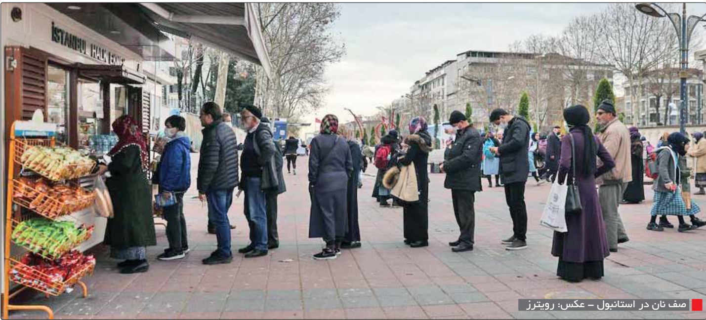
■ صف نان در استانبول

با کاهش ارزش پول ملی ترکیه، مردم این کشور برای تهیه مواد غذایی با مشکل مواجه شده‌اند و برخی مجبور به ایستادن در صف برای خرید نان هستند