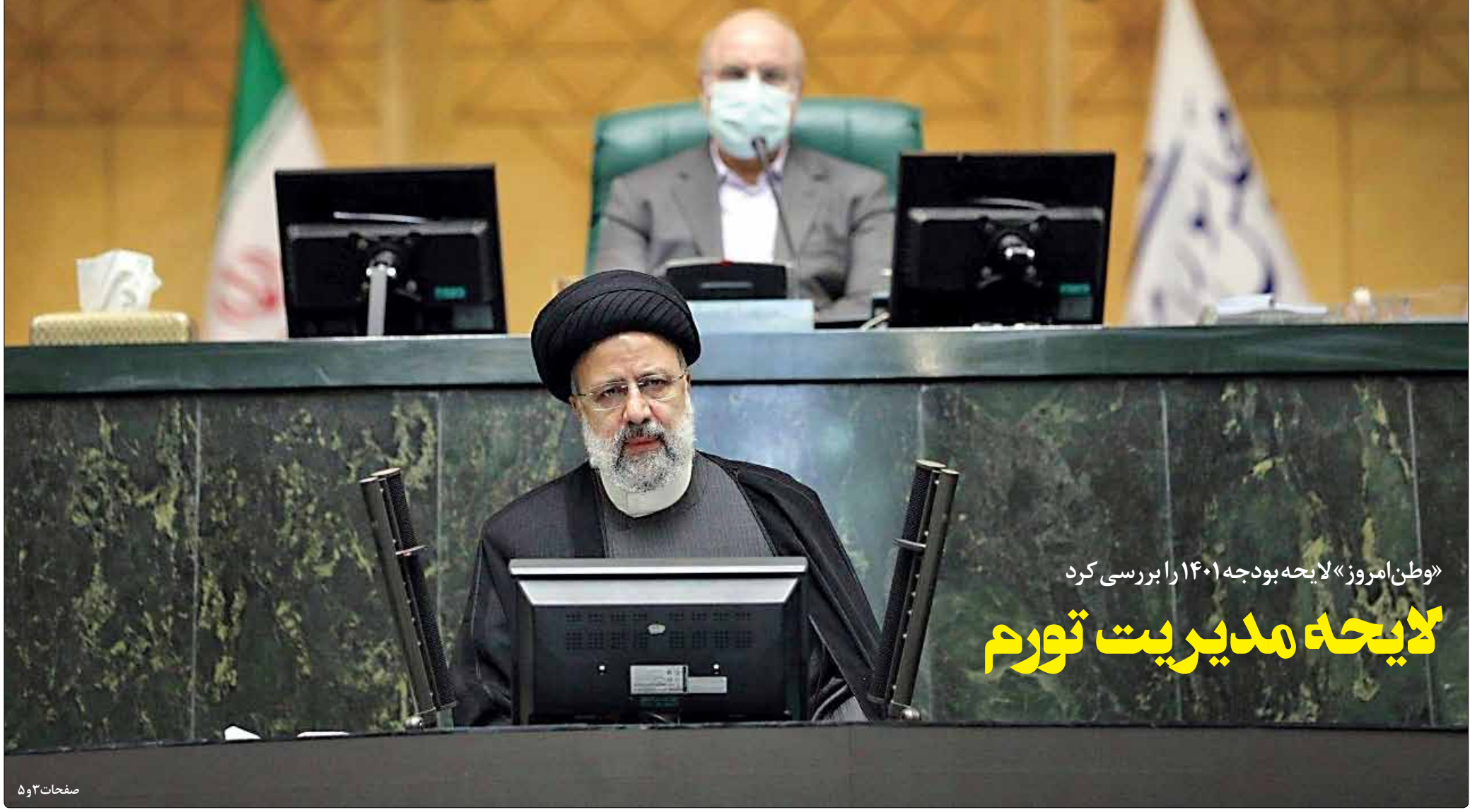
«وطن امروز» لایحه بودجه ۱۴۰۱ را بررسی کرد