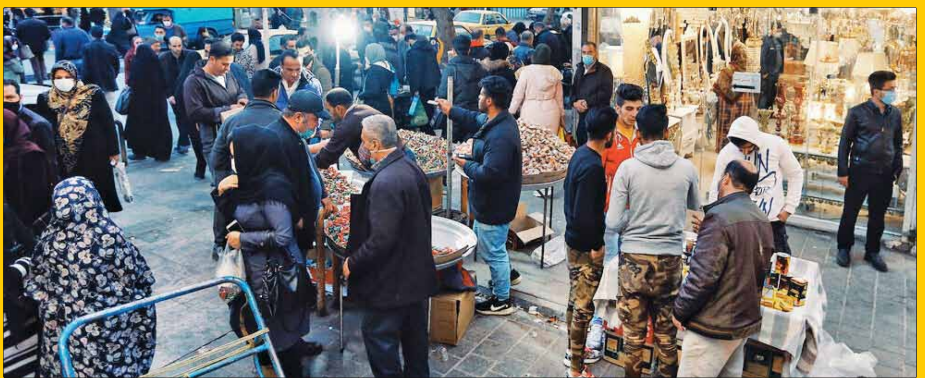
گزارش «وطن امروز» از آخرین وضعیت تورم