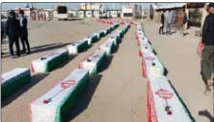
شهیدان و خانواده‌هایشان در مراسم تشییع شهدای خرمشهر