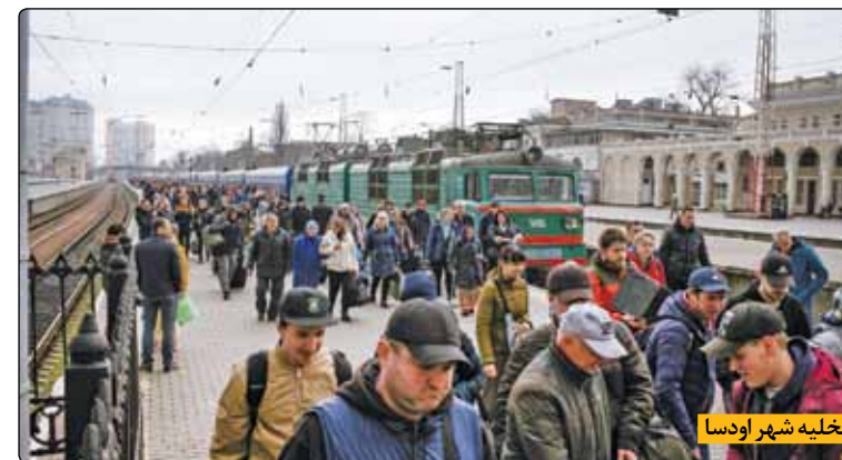
تخلیه شهر اودسا