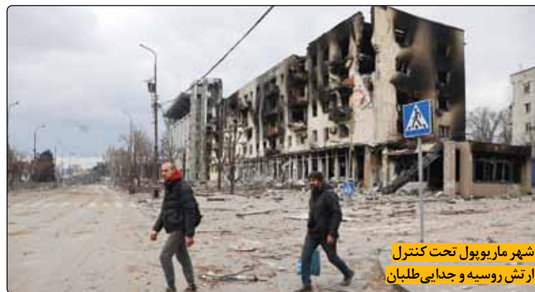
شهر ماریوپول تحت کنترل از تشر روسیه و جدایی طلبان