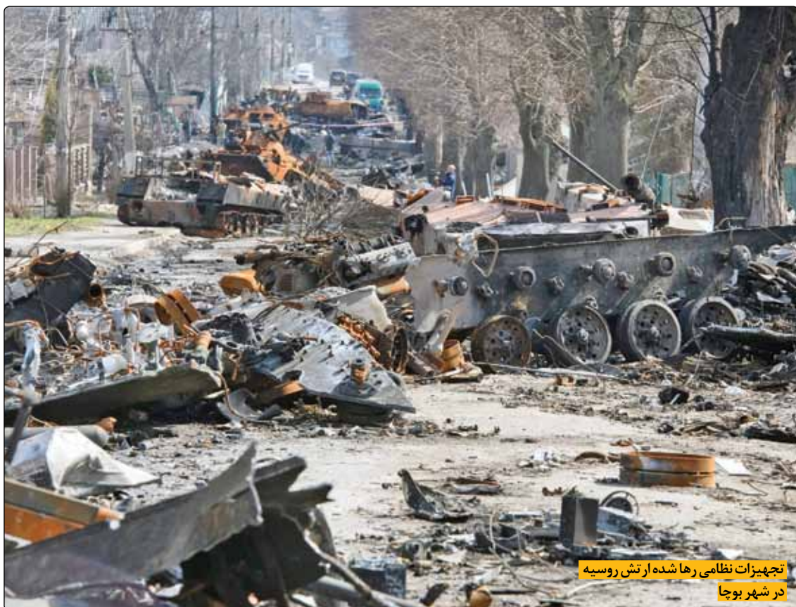
تجهیزات نظامی رها شده از تشر روسیه در شهر بوجا