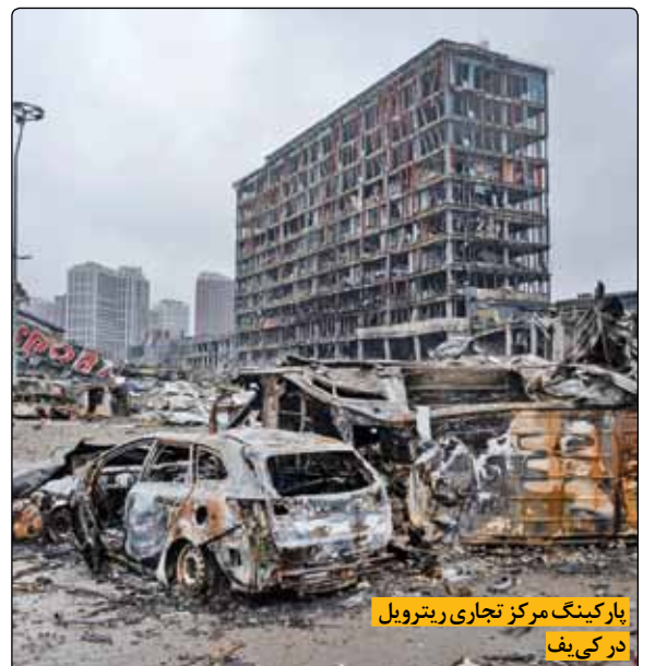
پارکینگ مرکز تجاری ریترویل در کی‌یف