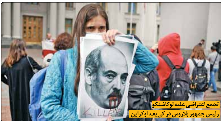
تجمع اعتراضی علیه لوکاشنکو رئیس جمهور بلاروس در کی‌یف، اوکراین

متأخر آمدن «إِذَا دَعَانِ» تداعی کننده انحصار نیز هست. یعنی خدا به دعای کسی ترتیب اثر می‌دهد که فقط از او بخواهد. البته این حرف رحمت به این قاطعیت درست باشد. چون دعا و اجابت باب واسع رحمت حق است و چنین داعی کمال دعاست و چنین اجابتی، اوج اجابت است که نایاب است. یعنی خدا دعای هر کس را که به او رو می‌کند، گرچه دل در گرو اسباب هم داشته باشد، می‌شنود و به مصلحت اجابت می‌کند. آری! این خدای قریب، خدای رفیق و شفیق همه بندگان است نه فقط خدای اولیا و انبیا. البته هر چه بنده از جز خدا دل بکند و خالصی تر رو به خدا کند و بیشتر مصداق «إِيَّاكَ نَعْبُدُ وَإِيَّاكَ نَسْتَعِينُ» باشد، اجابت خدا هم نسبت به او کامل تر و کریمانه‌تر است. یعنی اجابت هم مثل دعا در درجات دارد و درجات کاملش مخصوص اهل خلوص و خواص است. برای همین دعای ما با دعای انبیا و استغفار ما با استغفار آنها - هم دواعی‌اش، هم معرفت همراهش، و هم عمق و خلوص - فرق می‌کند. منتها همه دعاها پیش حضرت حق