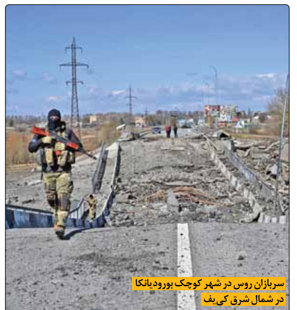
سربازان روس در شهر کوچک بورودانکا در شمال شرق کی‌یف