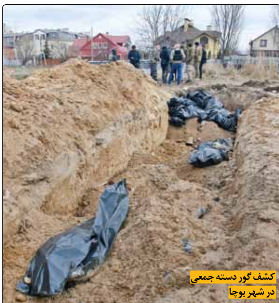
کشف گور دسته جمعی در شهر بوجا