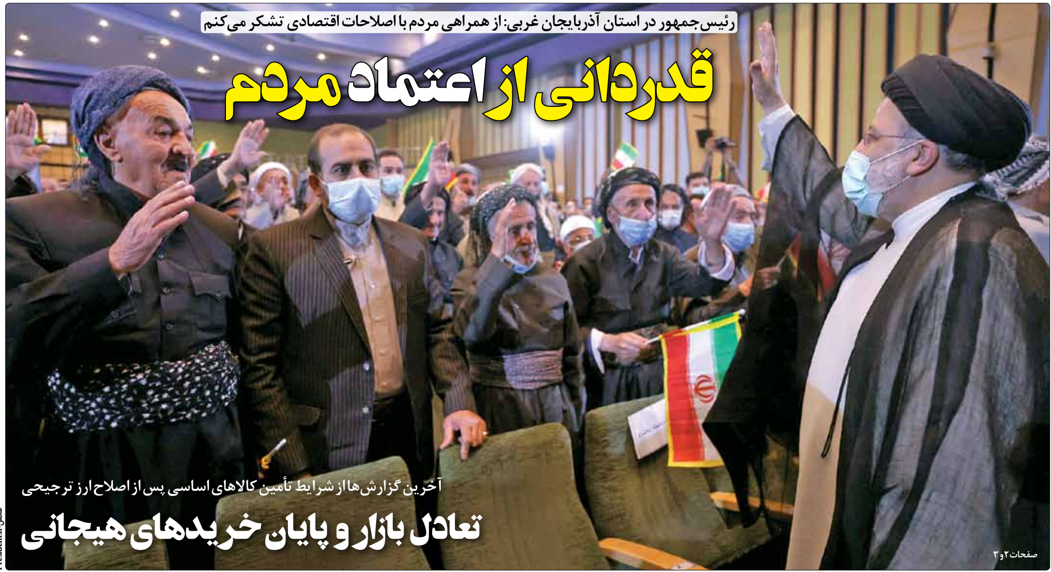
رئیس‌جمهور در استان آذربایجان غربی: از همراهی مردم با اصلاحات اقتصادی تشکر می‌کنم