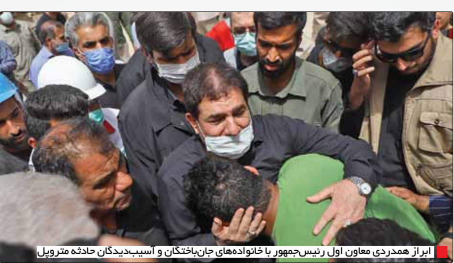
ابراز همدردی معاون اول رئیس‌جمهور با خانواده‌های جان‌باختگان و آسیب‌دیدگان حادثه متروپل

وزیر کشور: با دستور رهبر معظم انقلاب و ابلاغ رئیس‌جمهور، عملیات آواربرداری و خطرزدایی سرعت گرفته است