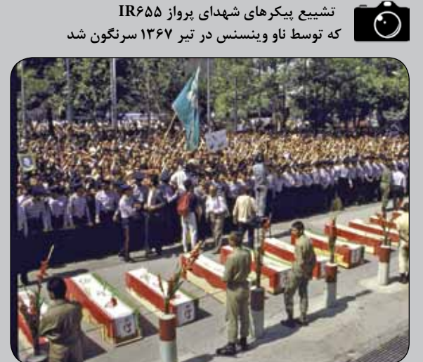
تشییع پیکرهای شهدای پرواز IR۶۵۵ که توسط ناو وینسنس در تیر ۱۳۶۷ سرنگون شد