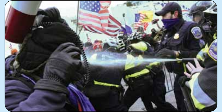
درگیری حامیان ترامپ با افسران پلیس مقابل ساختمان کنگره در واشنگتن