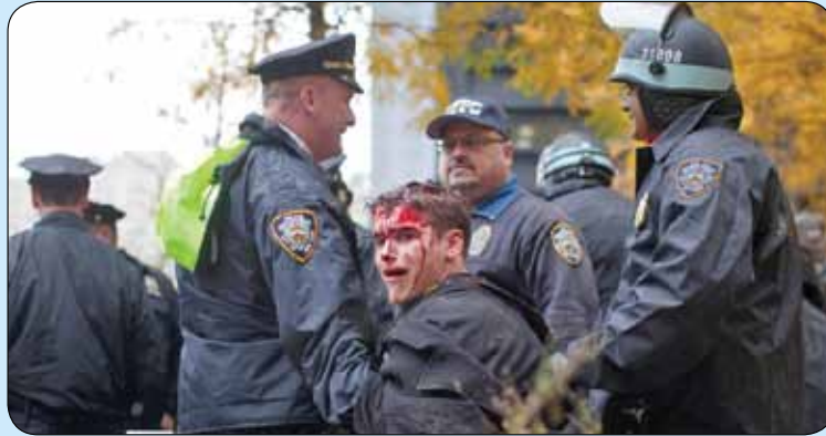
برخورد وحشیانه پلیس با شهروندان آمریکایی معترض در جنبش اشغال وال استریت

جنایت، جنگ و کشتار از سوی دولت آمریکا عمری به درازای تشکیل ایالات متحده دارد. تجاوز حاکمیت آمریکا به کشورهای دیگر و حتی مردم خودش، موجب شده انسان‌های بی‌گناه بسیاری در گوشه‌وکنار جهان به خاک و خون کشیده شوند. این رفتار آمریکا باعث انزجار همه مردم جهان و حتی خود شهروندان این کشور شده است. در این میان دولت آمریکا بعد از پیروزی انقلاب اسلامی ایران همواره به دنبال طراحی توطئه علیه مردم کشورمان بوده است که نمونه‌های بسیاری از این دشمنی‌ها در طول تاریخ حیات جمهوری اسلامی وجود دارد؛ از جمله ۱۲ تیر ۶۷ که پرواز مسافری شماره ۶۵۵ شرکت هواپیمایی ایران‌ایر با شناسه «IR ۶۵۵» از تهران به مقصد دوی در حرکت بود اما با موشک از ناو «یواس اس وینسنس» آمریکا در خلیج فارس هدف قرار گرفت و تمام ۲۹۰ سرنشین آن، از جمله ۴۶ مسافر غیرایرانی و ۶۶ کودک جان باختند. تصاویر برخورد پلیس آمریکا با مردم در پی جنبش اشغال وال استریت در سال ۲۰۱۲ میلادی نیز خود گواهی بر این مدعا است که ایالات متحده اساساً ناقض حقوق بشر است. قتل «جورج فلوید» شهروند سیاه‌پوست آمریکایی توسط پلیس این کشور اعتراضات گسترده‌ای را نه تنها در آمریکا، بلکه سراسر جهان در پی داشت و منجر به شکل‌گیری جنبش «زندگی سیاه‌پوستان مهم است» شد. در پی آن مردم در شهرهای سراسر جهان گرد هم آمدند و در محکومیت پلیس آمریکا دست به تظاهرات زدند. حالا شرایط علیه حاکمیت آمریکا به جایی رسیده است که شهروندان این کشور نمادهای ملی خود را نیز به تمسخر می‌گیرند. مجموعه‌ای از تصاویر مربوط به این اتفاقات را که نمایانگر «حقوق بشر آمریکایی» است، گرد آورده‌ایم.