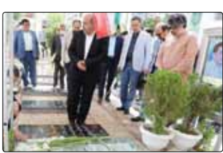
معاون سیما در جریان سفر به استان

کرمان اعلام کرد ساخت چند سریال با محوریت سردار شهید قاسم سلیمانی در نظر گرفته شده است که ساخت یکی از آنها بزودی آغاز خواهد شد. به گزارش «وطن‌امروز»، محسن برمهانی و اعضای شورای مدیران تلویزیون، در نخستین