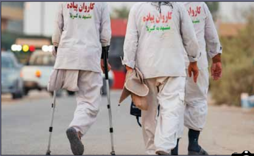
کاروان زائران اربعین در عراق