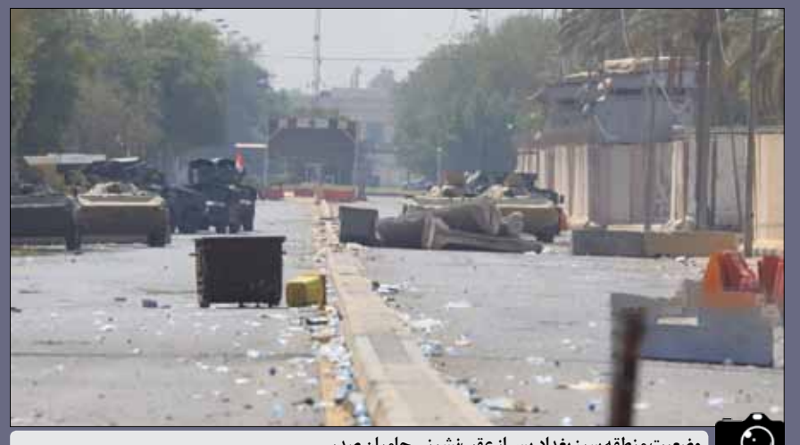
وضعیت منطقه سبز بغداد پس از عقب‌نشینی حامیان صدر