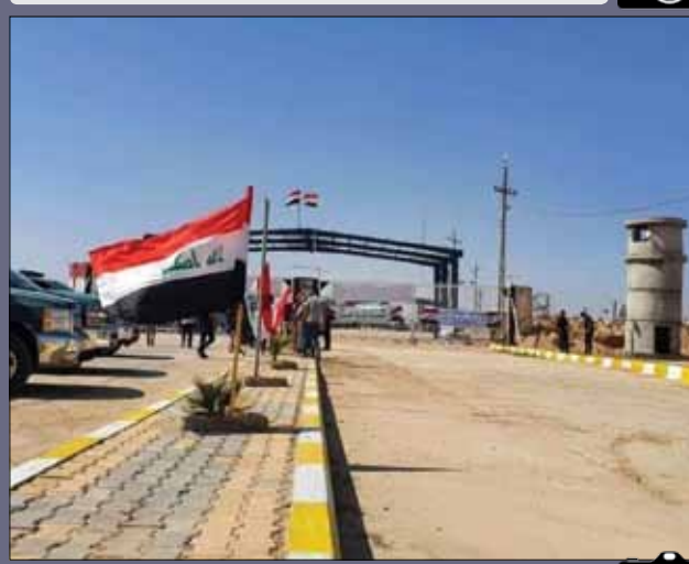
بسته شدن مرز از سمت عراق