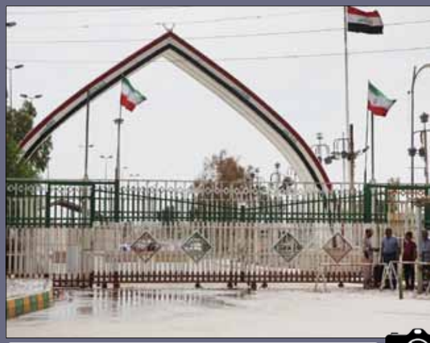
بسته شدن مرز خسروی پس از اعلام ناآرامی‌ها در عراق