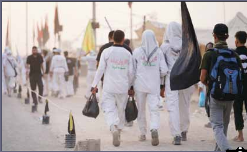
پیاده‌روی زائران اربعین در عراق

در آستانه اربعین حسینی و با توجه به اعلامیه آیت‌الله‌العظمی سید کاظم حسینی حائری مبنی بر عدم تفرقه‌افکنی و اطاعت همه مؤمنان از آیت‌الله‌العظمی سیدعلی خامنه‌ای، روز گذشته مقتدا صدر در نشست خبری ضمن عذرخواهی از مردم عراق و اعلام پیروی از مرجعیت، به طیف حامیان خود مهلتی یک ساعته برای تخلیه منطقه سبز بغداد داد. حامیان وی نیز این منطقه را تخلیه کردند و شرایط کنونی در عراق، امن و باثبات است. مرزهای هوایی و زمینی نیز که در روز دوشنبه هفتم مرداد از طرف عراقی بسته شده بود، اکنون آماده بازگشایی مجدد و سرویس‌دهی به زائران حسینی است. مسیرهای پیاده‌روی اربعین هم ساعت به ساعت شاهد افزایش جمعیت است. همچنین موبک‌ها نیز راه‌اندازی شده و خدمات‌دهی به زوار اباعبدالله‌الحسین(ع) را آغاز کرده‌اند. اکنون زائران در کربلا در آرامش و امنیت کامل در حال زیارت حرم مطهر امام حسین(ع) هستند و مراسم عزاداری طبق برنامه‌ریزی‌های انجام شده در حال برگزاری است. بخشی از رویدادهای ۲ روز گذشته در عراق را در قاب «وطن امروز» مشاهده می‌کنید. خانواده «وطن امروز» از تمام زوار اربعین حسینی طلب نیابت زیارت دارد.