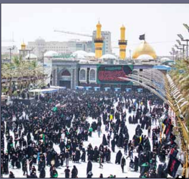
بین‌الحرمین در آستانه اربعین حسینی