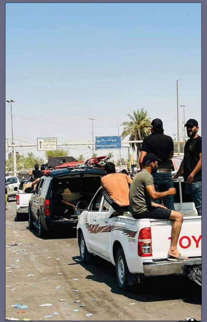
عقب‌نشینی حامیان صدر از منطقه سبز بغداد