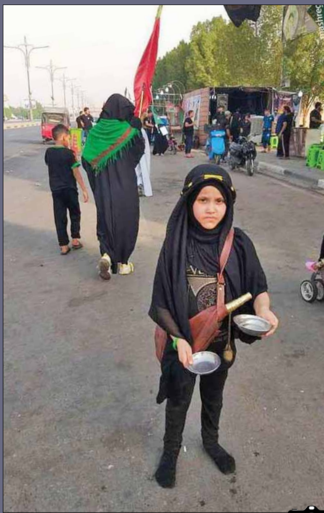
خدمت‌رسانی موبک‌ها به زائران اربعین