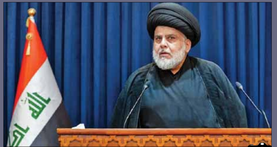
عذرخواهی مقتدا صدر در نشست خبری و اعلام پیروی از مرجعیت