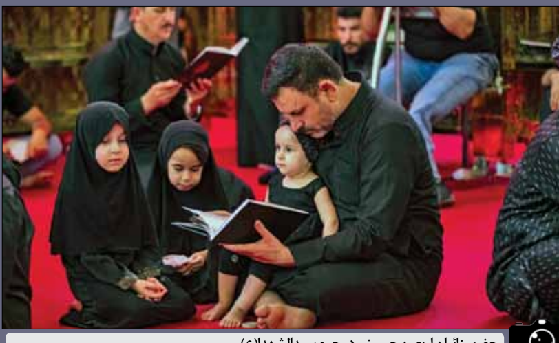
حضور زائران اربعین حسینی در حرم سیدالشهدا(ع)

در آستانه اربعین حسینی و با توجه به اعلامیه آیت‌الله‌العظمی سید کاظم حسینی حائری مبنی بر عدم تفرقه‌افکنی و اطاعت همه مؤمنان از آیت‌الله‌العظمی سیدعلی خامنه‌ای، روز گذشته مقتدا صدر در نشست خبری ضمن عذرخواهی از مردم عراق و اعلام پیروی از مرجعیت، به طیف حامیان خود مهلتی یک ساعته برای تخلیه منطقه سبز بغداد داد. حامیان وی نیز این منطقه را تخلیه کردند و شرایط کنونی در عراق، امن و باثبات است. مرزهای هوایی و زمینی نیز که در روز دوشنبه هفتم مرداد از طرف عراقی بسته شده بود، اکنون آماده بازگشایی مجدد و سرویس‌دهی به زائران حسینی است. مسیرهای پیاده‌روی اربعین هم ساعت به ساعت شاهد افزایش جمعیت است. همچنین موبک‌ها نیز راه‌اندازی شده و خدمات‌دهی به زوار اباعبدالله‌الحسین(ع) را آغاز کرده‌اند. اکنون زائران در کربلا در آرامش و امنیت کامل در حال زیارت حرم مطهر امام حسین(ع) هستند و مراسم عزاداری طبق برنامه‌ریزی‌های انجام شده در حال برگزاری است. بخشی از رویدادهای ۲ روز گذشته در عراق را در قاب «وطن امروز» مشاهده می‌کنید. خانواده «وطن امروز» از تمام زوار اربعین حسینی طلب نیابت زیارت دارد.