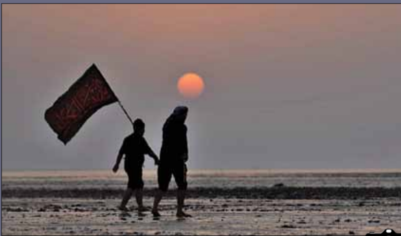
پیاده‌روی زائران اربعین به سمت کربلا