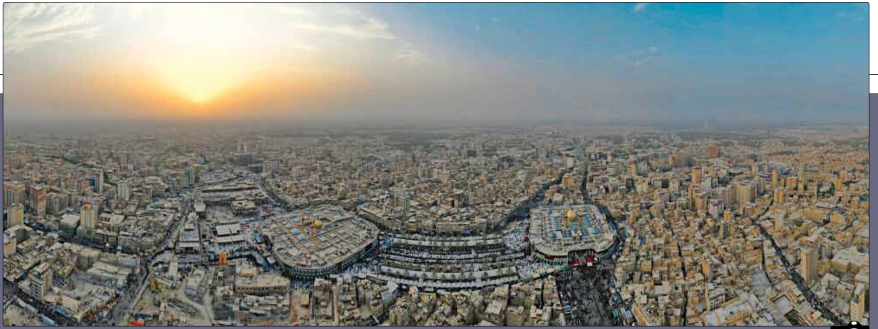
تصویر هوایی از کربلای معلاد در آستانه اربعین حسینی