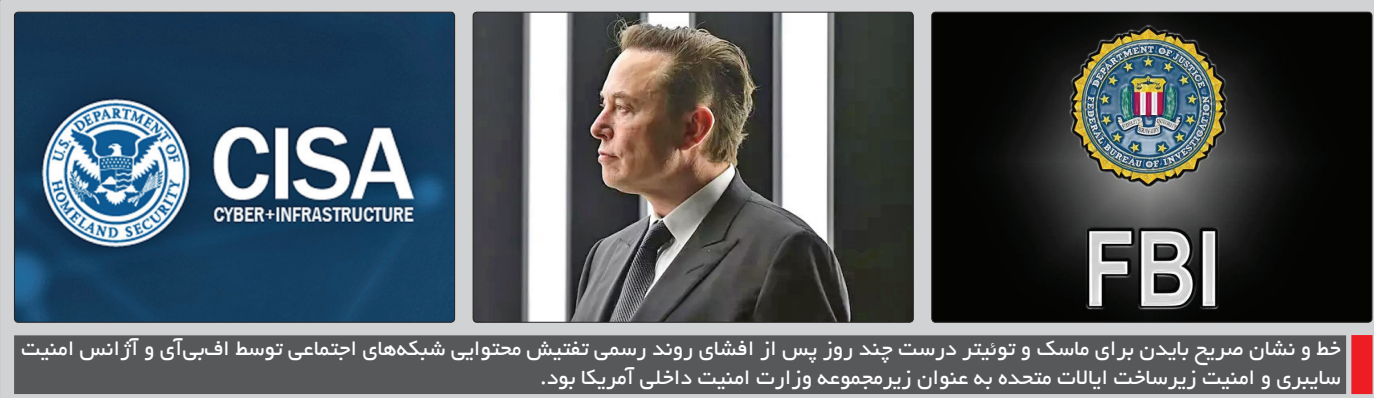
خط و نشان صریح بایدن برای ماسک و توییت درست چند روز پس از افشای روند رسمی تفتیش محتوایی شبکه‌های اجتماعی توسط افبی‌آی و آژانس امنیت سایبری و امنیت زیرساخت ایالات متحده به عنوان زیرمجموعه وزارت امنیت داخلی آمریکا بود.

واکنش‌های سیاسی به تغییر مالکیت توییت فقط از کاخ سفید و محافل سیاسی شنیده نمی‌شوند. به عنوان مثال «شاشا هاورث» مدیر اجرایی شرکت «تک اوور سایت پراجکت» سعی می‌کند کنترل ماسک بر توییت را به وقایع نگران‌کننده روز که به جمهوری خواهان افراطی نسبت داده می‌شود ربط دهد. او می‌گوید: «حمله وحشتناک به همسر نانسی پلوسی نشان داد چگونه تئوری‌های توطئه مطرح شده در رسانه‌های اجتماعی می‌تواند منجر به وقوع خشونت در دنیای واقعی شود. با این حال ایلان ماسک با این کارش به