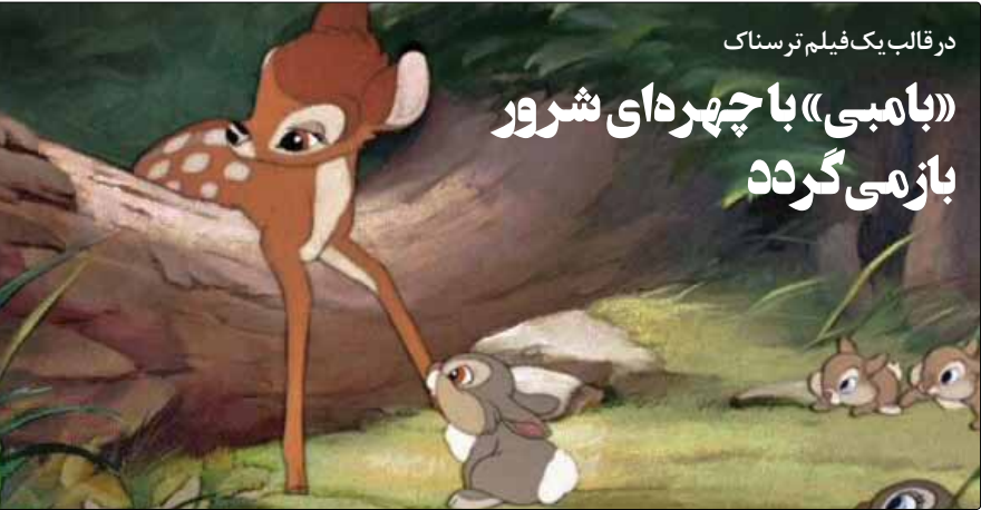
در قالب یک فیلم ترسناک

وی که ۶۷ ساله است، گفت به فیلم‌هایی که نمایش‌دهنده سینمای هند هستند، افتخار می‌کند. این بازیگر پرکار در جشنواره بین‌المللی فیلم هند یک مستر کلاس با موضوع «تمایش برای نمایش و تئاتر» برگزار کرد.