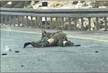
یک شهروند فلسطینی در جریان یک عملیات ضد صهیونیستی در کرانه باختری.

ایس رژیم به شهرک «بیت امر» در «الخلیل» ۲ تن از آنها زخمی شدند. کرانه باختری اشغالی طی روزهای اخیر شاهد افزایش شدت خشونت و جنایات صهیونیست‌ها در چندین شهر و روستا بوده‌است. نظامیان صهیونیست در این عملیات‌ها با اعمال خشونت‌های افراطی شماری از شهروندان فلسطینی را