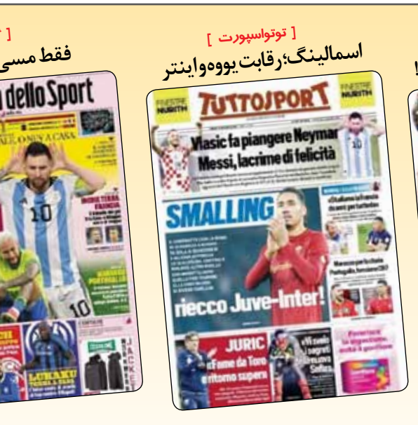
مسی خندید، تیمار گریست [آ.اس.] فقط مسی می‌رقصد [کاترزا] اسمایلینگ: رقابت یوهو واینتر [توتواسپورت] ببینید چه کسانی می‌رقصند! [مارکا]