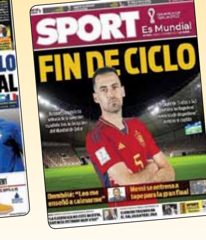
این یک افتخار بود