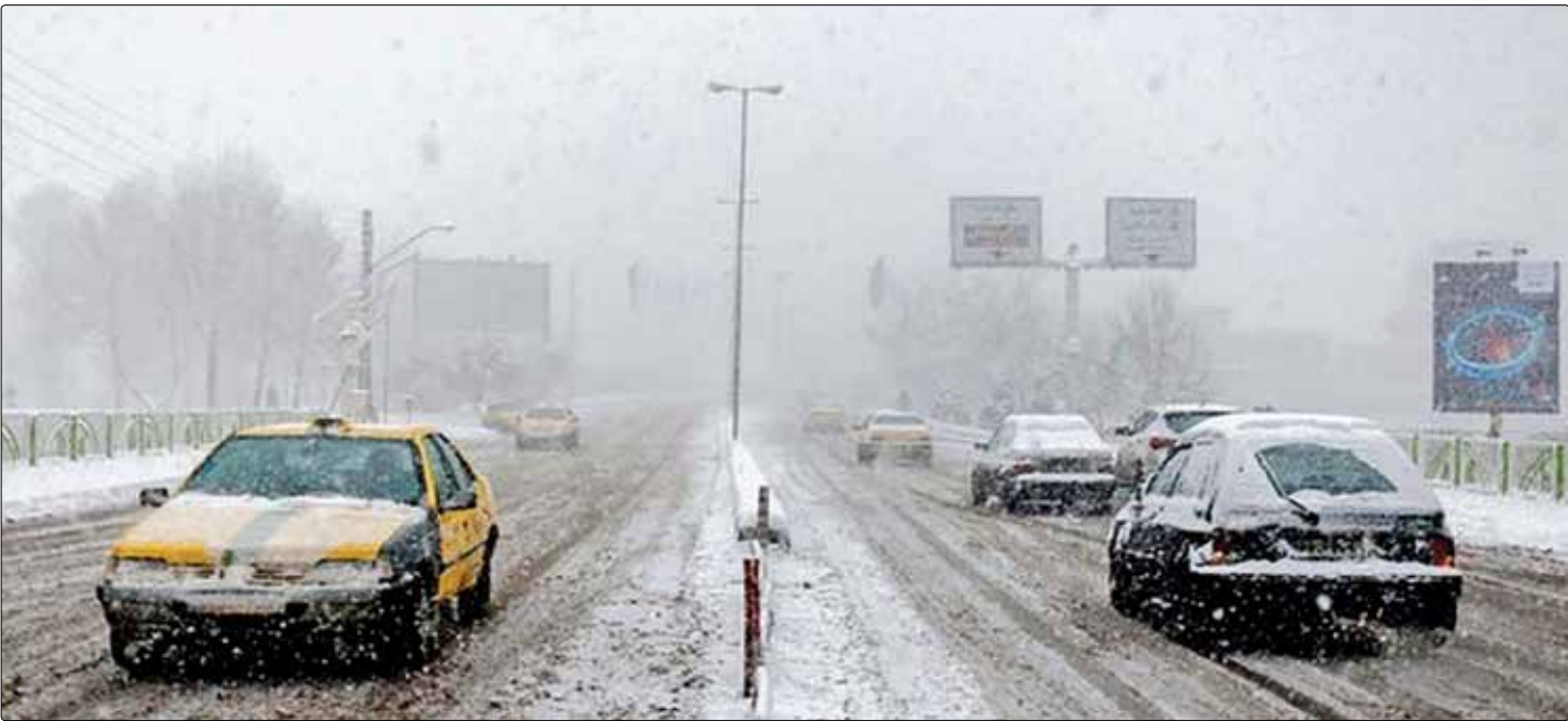
بارش برف در خیابان‌های تهران در روز شنبه ۹ بهمن ۱۴۰۱

مدیر کل پیش‌بینی و هشدار سریع سازمان هواشناسی کشور در گفت‌وگو با «وطن امروز»: بارش‌های هفته جاری بخشی از کمبودها را بهبود می‌بخشد