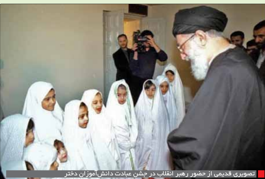
تصویری قدیمی از حضور رهبر انقلاب در جشن عبادت دانش آموزان دختر