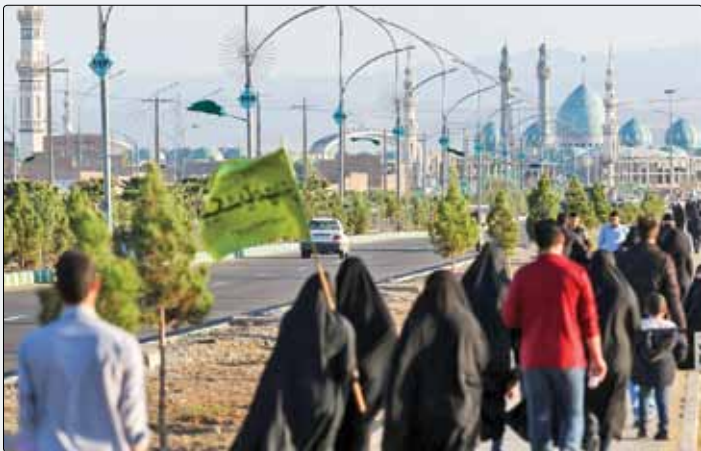
بیانات رهبر انقلاب پیرامون معنای انتظار فرج